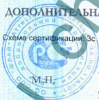
Схема сертификации 3с